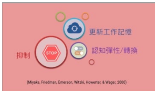
圖1 執行功能具有三大成分。

不過研究顯示的是平均，就表示有人可能沒有發展好執行功能，例如有些學生，被要求寫字時就兩手一攤：我不會。他已經不具備挑戰的動能。合理的推測如果到了二年級學生字還是遇到困難，可能就是大腦的執行功能沒有發展成熟。